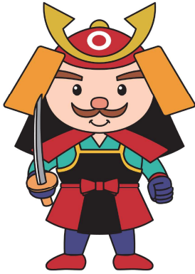
松山城マスコットキャラクター 「よしあきくん」