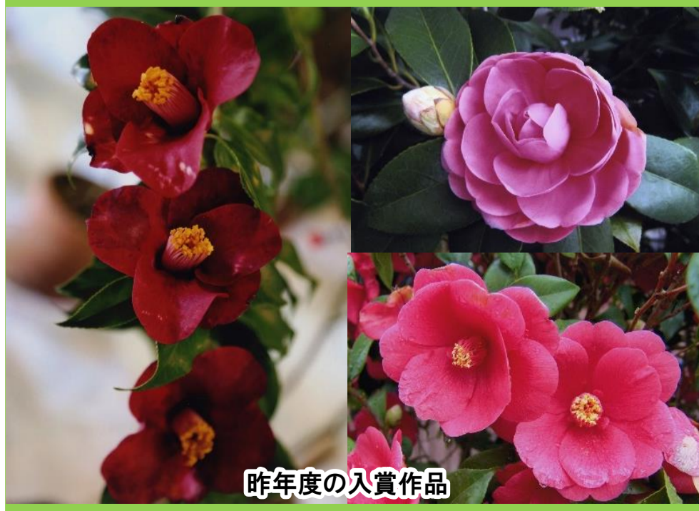
昨年度の入賞作品