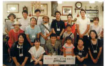
▲交流会での記念撮影

松山市では、移住者同士のつながりをつくろうと移住者交流会「いい、暮らし。まつやま交流カフェ」を開催しました。このカフェメンバーが先輩移住者として皆さんのお越しをお待ちしています!