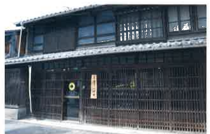
▲築150年の日本建築が事務所

松山の玄関口として栄えた港町・三津浜。今では商店街もシャッターが目立つようになりました。そんな三津浜を盛り上げようと、イベントの開催や空き家と借り手のマッチングなどを行っているのが「ミツハマル」です。三津浜に是非ハマりに来てください!