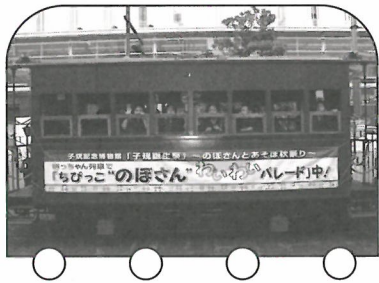
協力 / 伊予鉄道株式会社

順路: 正宗寺 9:00 発→伊予鉄松山市駅 9:17 発 (『坊っちゃん列車』乗車) →伊予鉄道後温泉駅 9:33 着→子規博到着 10:10 頃