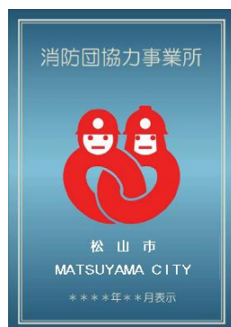
松山市が交付する表示証