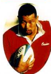
現役時代の大八木さん