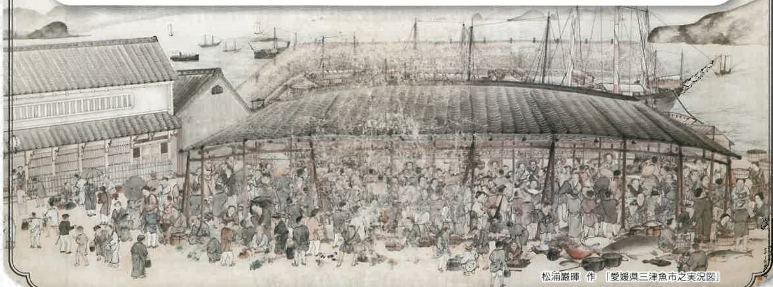
松浦巖暉 作 「愛媛県三津魚市之美況図」