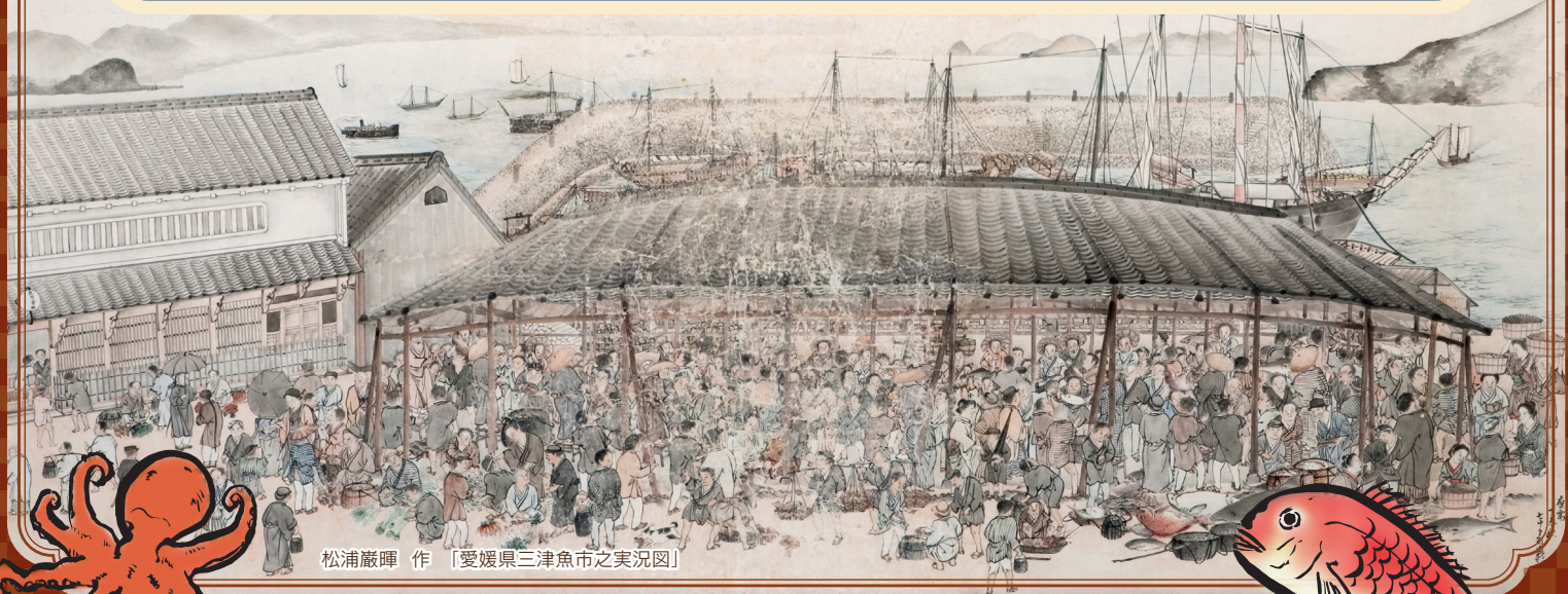
松浦巖暉 作「愛媛県三津魚市之実況図」