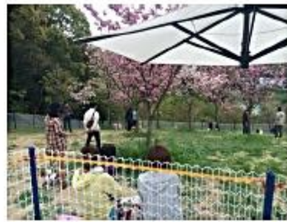
小型犬ドッグラン