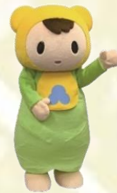
なのほちゃん (洲本市)