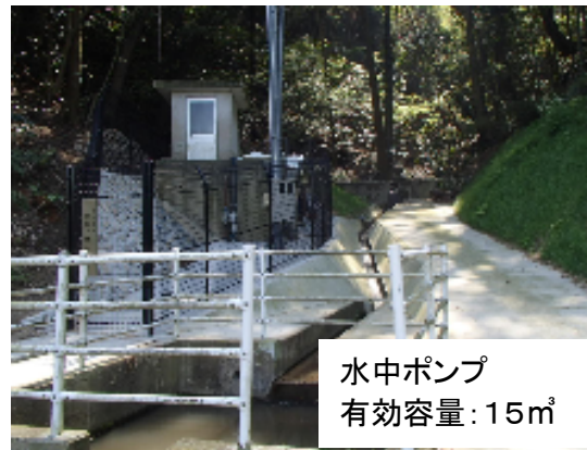
宮浦中継ポンプ井