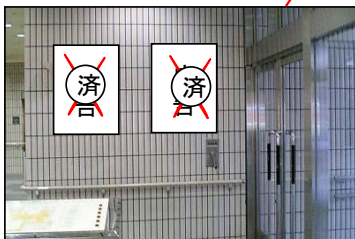
④1階玄関横掲出場所(2枠)