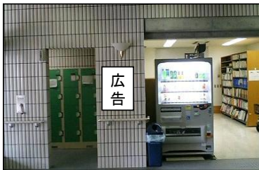
①1階自動販売機横掲出場所