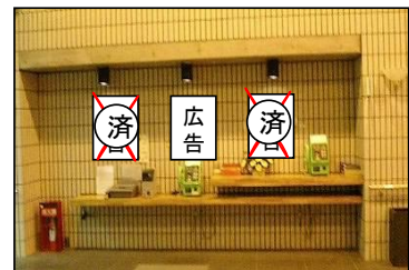
③1階ロビー公衆電話前掲出場所(3枠)