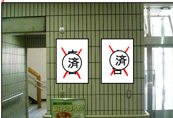
⑤1階エレベーター横掲出場所(2枠)