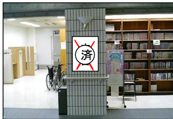
②1階書庫横掲出場所