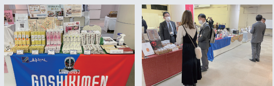
令和4年度の商談会の様子