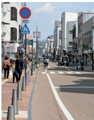
整備されたロープウェー街