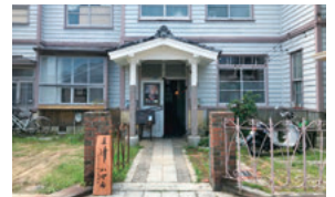
三津浜にぎわい創出事務所 三津ハマル