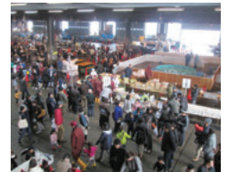
三津の朝市「旬・鮮・味まつり」