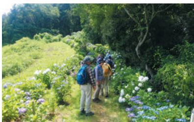
風早まち歩きツアー実施