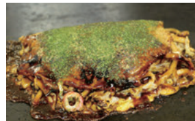
ご当地グルメ「三津浜焼き」