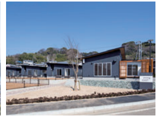
お試し移住施設「ハイムインゼルごこしま」