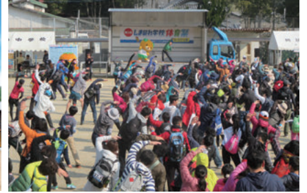
「しまのわ学校体育祭inごこしま」