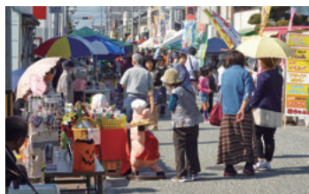
JR伊予北条駅前で行われている「かざはや楽市」