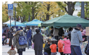
花園町で行われているイベント