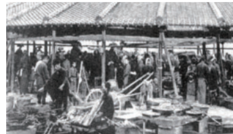
明治時代の三津の朝市

古民家や蔵のある町並みを活かして移住や出店を促す「町家バンク」の運営や、ご当地グルメ「三津浜焼き」のブランド化、水産市場でのイベント「三津の朝市「旬・鮮・味まつり」」を活用した食文化の推進など、地域住民が主体となって地域資源を活かした新たなにぎわいの創出に取り組み、同地区全体の活性化を進めます。