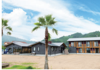
ほしふるテラス姫ヶ浜